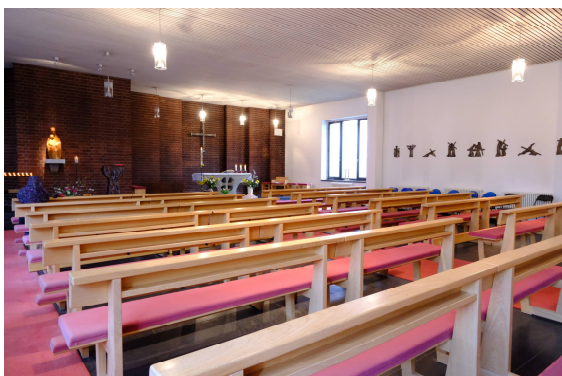
Das wohl beste Kirchengestühl in Schwerin mit bequemen Sitz und Kniebänken

Gaben. Hier, in der Feier seines Gedächtnisses, ist die Begegnung mit Christus immer wieder gegeben. Der Ort mag sich verändern, ich selbst mag mich verändern, aber Christus bleibt. Wir haben hier