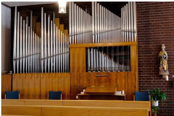
Die bereits verkaufte Orgel von St. Martin