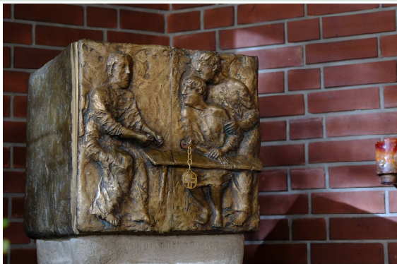
Tabernakel mit einer Darstellung der Emmausbrüder

Das Evangelium trägt die Elemente des heutigen Tages in sich. Es beginnt mit der Trauer, mit dem Bewusstsein der Jünger, dass mit dem Tod Jesu eine wichtige, vielleicht entscheidende Episode ihres Lebens zu Ende gegangen ist. Dann spricht das Evangelium von der Wanderung. Die Jünger machen sich auf den Weg. Sie suchen eine Veränderung, vielleicht auch einen neuen Ort, um neu zu beginnen. Dann ist es das Evangelium der Begegnung. Die Jünger bleiben auf ihrem Weg nicht allein. Jesus geht mit ihnen. Er erläutert ihnen die Heilige Schrift. Es ist eine Versicherung: Ihr könnt hoffnungsfroh sein. Das Ende ist nicht das Ende. Und schließlich kommt die österliche Erfahrung dazu. Die Jünger kehren mit Jesus im Dorf Emmaus zum Mahl ein. Jesus bricht ihnen das Brot und sie erkennen ihn wieder. Diese Szene ist auf dem Tabernakel unserer Kirche festgehalten, am Ort der eucharistischen